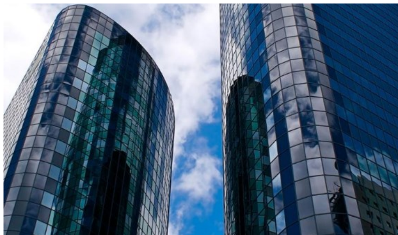
Nota : Couleur depuis l'extérieur NEUTRE