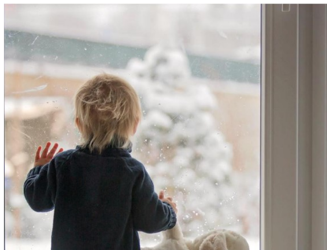
Nota : Couleur depuis l'extérieur ARGENT